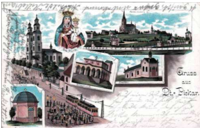
Piekary Śląskie (Deutsch-Piekar), wyd. 1899, Verlag Robe Ulrike, Beuthen o/S