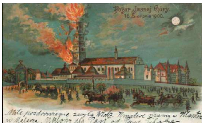
Jasna Góra – pożar wieży 15 sierpnia 1900 roku, wyd. 1900/1901 przez wydawcy)

W ażnym elementem dokumentacji w badaniach geograficznych są źródła ikonograficzne umożliwiające zidentyfikowanie badanego obiektu, spojrzenie na niego z perspektywy historycznej i porównanie ze stanem istniejącym. Jeden z typów takich źródeł stanowią stare pocztówki (widokówki). Jak do tej pory w studiach prowadzonych przez geografów ten rodzaj informacji ikonograficznej nie był należycie