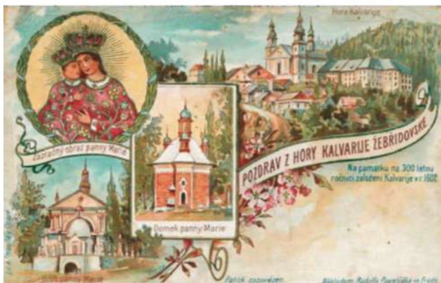
Kalwaria Zebrzydowska, wyd. 1902, Nakładem Rudolfa Pawełczyka, Frydek