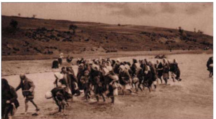
Kalwaria Paćławska - przejście pielgrzymów przez Cedron, wyd. 1932, (brak wydawcy)