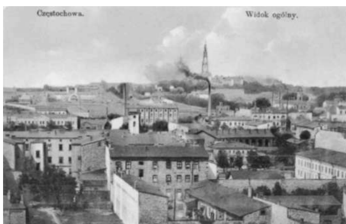
Częstochowa – widok z miasta na Jasną Górę, wyd. 1913, Krajowy Dom Wydawniczy F. Karpowicz, Warszawa