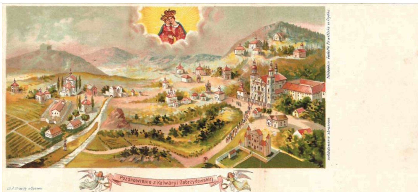
Pozdrowienie z Kalwarii Zebrzydowskiej, około 1910, Lit. A. Strasilly w Opawie, Nakładem Rudolf Pawlak we Frydku