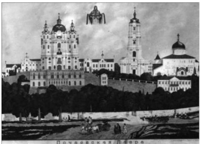
Poczajów – Ławra, wyd. ok. 1910 (brak wydawcy)