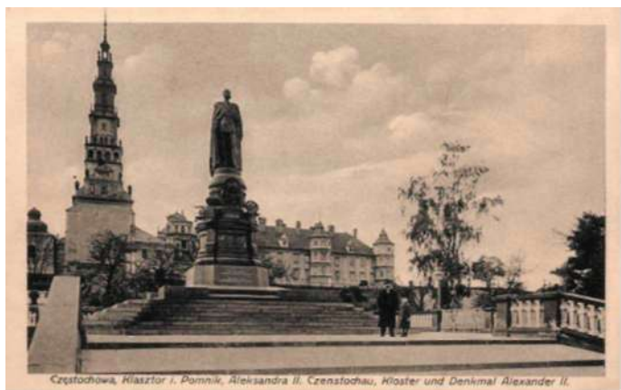
Częstochowa – pomnik cara Aleksandra II u stóp Jasnej Góry, wyd. ok. 1915, Cremers Kunstanstalt, Dortmund (pomnik wzniesiono w 1889 roku, zburzono w 1917 r. Na miejscu pomnika znajduje się cokół z figurą Matki Bożej)