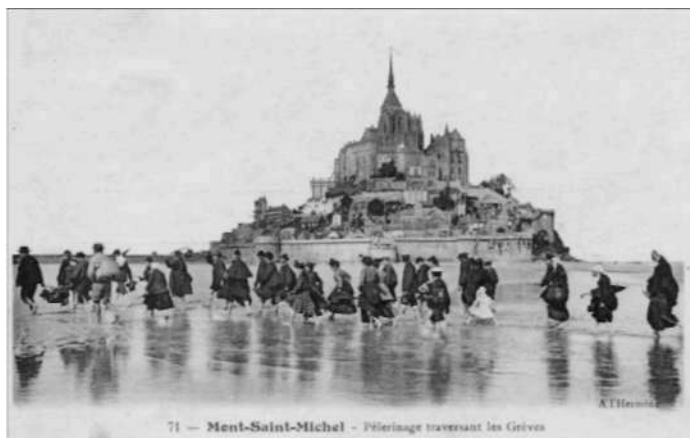
Mont-Saint-Michel – pielgrzymi w drodze do sanktuarium, wyd. ok. 1910, l'Hermine