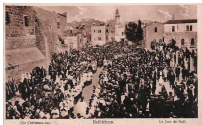
Betlejem – pielgrzymi w Dniu Bożego Narodzenia, wyd. ok. 1930, ed. Georges A. Michel, Bethlehem

Z pocztówek zagranicznych najwięcej okazów (ponad 100) dotyczy Lourdes. Niektóre pochodzą z XIX wieku, ale większość z okresu 1900–1918, który decydował o dzisiejszej randze tego ośrodka. Wiele pocztówek poświęcono charakterystycznej grupie pielgrzymów,