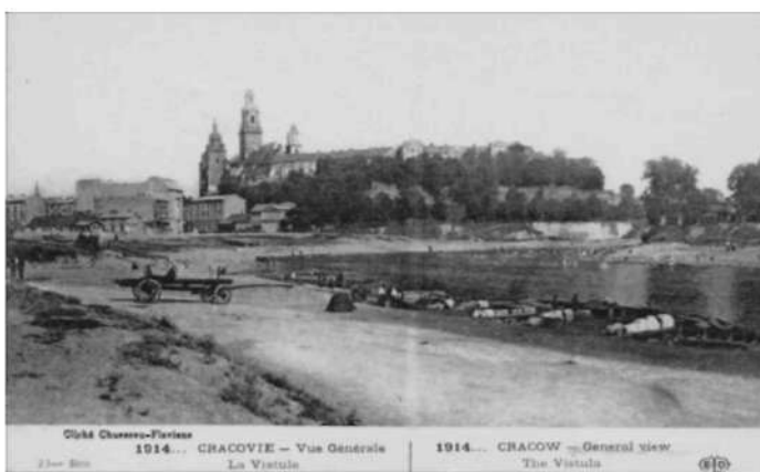
Kraków – widok na Wawel z zakola Wisły, wyd. 1914, E. Le Deley, Paris