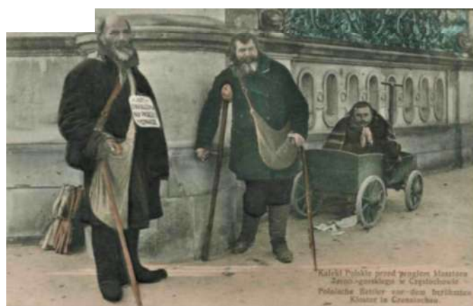
Jasna Góra – żebracy, wyd. ok. 1914 (brak wydawcy)