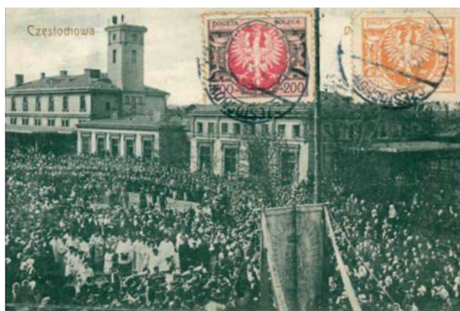
Częstochowa – dworzec kolejowy, przybycie kompanii pielgrzymkowej, wyd. ok. 1920, Księg. F. Rolnickiego