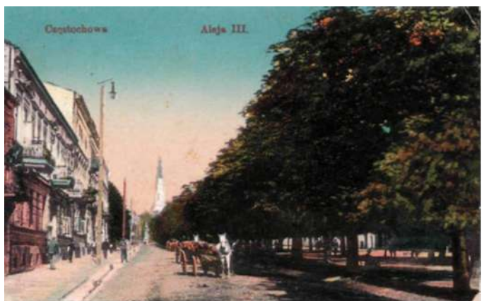
Częstochowa – Aleje NMP (III Aleja), wyd. ok. 1910 (brak wydawcy)