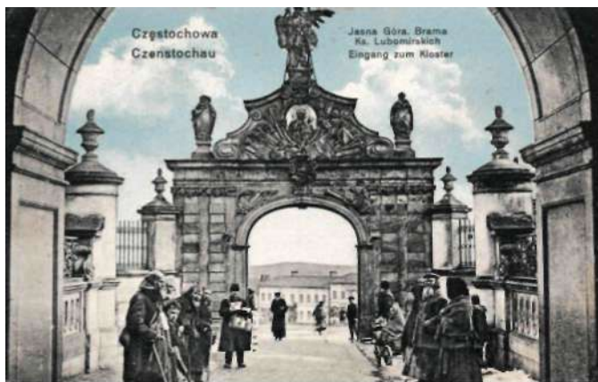
Jasna Góra – główna Brama Lubomirskich, charakterystyczni żebracy, wyd. ok. 1918 (brak wydawcy)