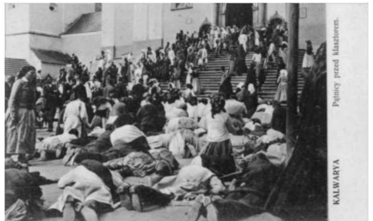
Kalwaria Zebrzydowska – pielgrzymi na schodach klasztornych, wyd. ok. 1910, Salon Malarzy Polskich