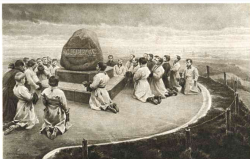
Kraków – uczestnicy pielgrzymki narodowej na Kopcu Kościuszki, wyd. ok. 1910, aut. P. Stachiewicz, Nakładem Księgarni J. Czerneckiego w Krakowie