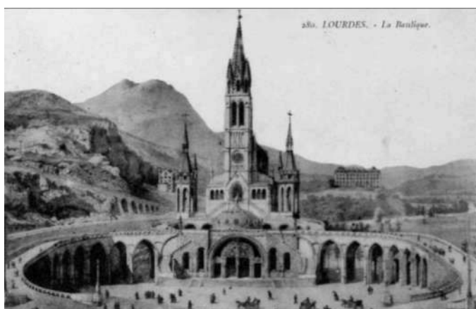
Lourdes - plac przed bazyliką, wyd. ok. 1910, ed. F. Viron

został zamieniony na obóz karny (łagier) dla duchowieństwa.