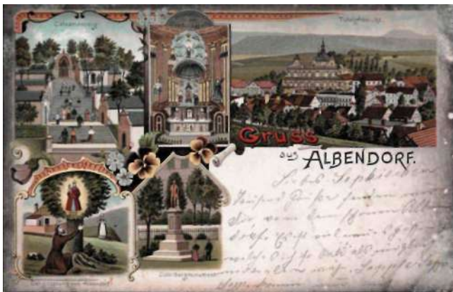
Wambierzyce (Albendorf), wyd. 1899 (brak wydawcy)

Wśród okazów dotyczących Polski dominują pocztówki związane z Jasną Górą i Częstochową (ponad 200). Niektóre