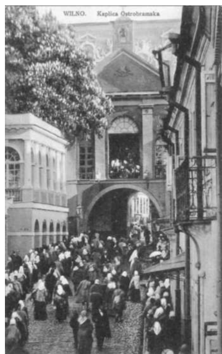
Wilno – Kaplica Ostrobramska, wyd. ok. 1914, Wyd. artystyczne D. Wizuna, Wilno