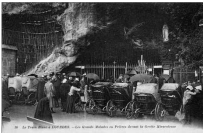
Lourdes – chorzy pielgrzymi przed Grotą, wyd. ok. 1920 (brak wydawcy)