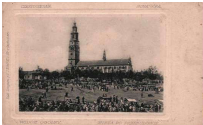
Jasna Góra z nową wieżą, wyd. 1906, Nakład księgarni J. Nowicki i Sp. w Częstochowie

ne oraz grupę „inne”. Najstarsze egzemplarze pochodzą z końca XIX wieku, ale rarytasami kolekcjonerskimi są też okazy z okresu 1900–1918 i niektóre z lat międzywojennych. „Najmłodsze” kartki datowane są na rok 1939 (Polska) bądź pierwszą połowę lat 40. (np. Lourdes). Taki rozkład wiekowy odnosi się do pocztówek związanych przede wszystkim z głównymi ośrodkami pielgrzymkowymi. Na zie-