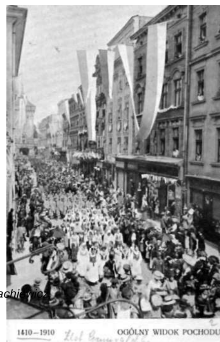
Kraków – pochód na Wawel uczestników odsłonięcia Pomnika Grunwaldzkiego, wyd. 1914, Nakładem Zakładu „Kamera” w Krakowie