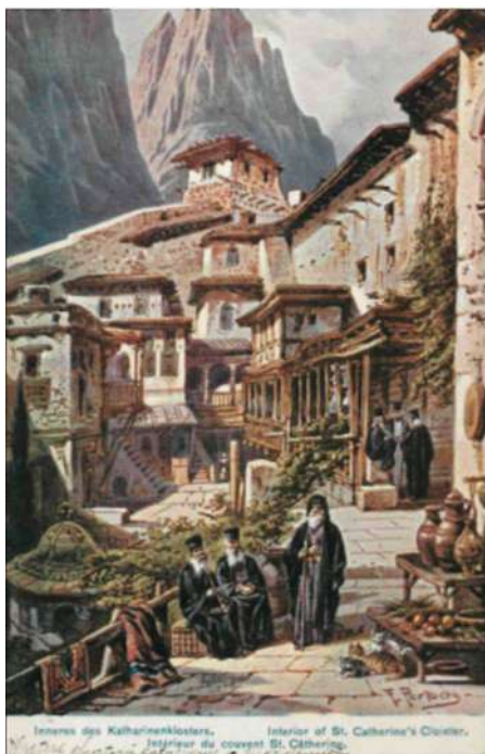
Ziemia Święta – klasztor św. Katarzyny, wyd. ok. 1910 (brak wydawcy)

się z kalwaryjskimi pielgrzymami a także z tutejszymi nabożeństwami maryjnymi i pasyjnymi. Cenny zbiór stanowią również pocztówki ukazujące ośrodki, które do drugiej wojny światowej znajdowały się poza granicami Polski. Dotyczy to zwłaszcza Wambierzyc, Barda Śląskiego i Góry Świętej Anny (w sumie ponad 100 pocztówek).