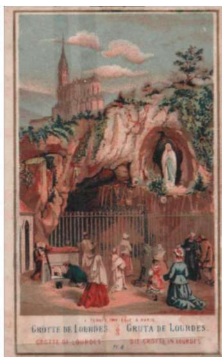
Lourdes – Jubileusz 25-lecia objawień Matki Bożej, wyd. 1883 (brak wydawcy)

mają już dziś charakter dokumentu, choćby te ilustrujące pożar wieży Jasnej Góry 15 sierpnia 1900 roku, pomnik cara Aleksandra znajdujący się pod szczytem klasztornym w latach 1889–1917, postaci żebraków, pierwsze widoki ukończonej w 1913 roku Drogi Krzyżowej czy pierwsze zdjęcia lotnicze zespołu klasztornego, stanowiące wspaniały materiał do studium przemian krajobrazu otoczenia Jasnej Góry. W przypadku samej Częstochowy podobne cechy mają stare widoki Alei Najświętszej Marii Panny, dworca „kolei żelaznej” czy dokumentujące Wystawę Przemysłowo-Rolniczą z 1909 roku, która odegrała ważną rolę w rozwoju miasta, a także pielgrzymek.