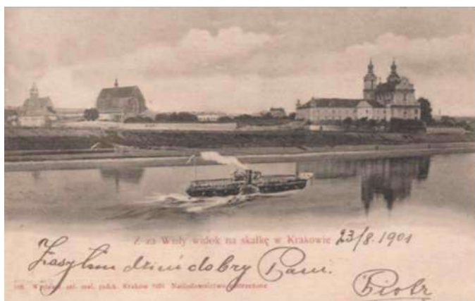
Kraków – widok na Skalkę, wyd. 1901, Salon Malarzy Polskich