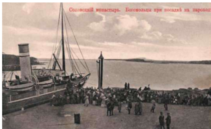
Wyspy Sołowickie – przybycie pielgrzymów, wyd. ok. 1910 (brak wydawcy)